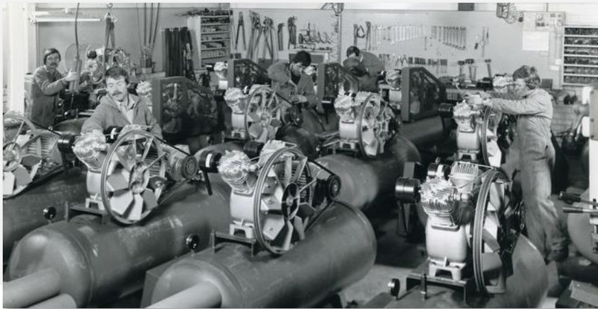
Compressoren bij Berko in de jaren 70

De parallellen met de huidige tijd zijn onmiskenbaar. Europa bevindt zich in een diepe economische crisis. Economische ontwikkeling stimuleren en werkloosheid beperken zijn dé topprioriteiten van de overheid en het bedrijfsleven. De stilval van het internationale handelsverkeer tijdens de lockdown heeft de ogen geopend: hoogwaardige productie van eigen bodem is van cruciaal belang. Tegelijk hebben maakbedrijven het zwaar in deze crisis. Vraaguitval en leveringsproblemen komen bovenop de volgende uitdagingen die deze sectoren toch al hadden: