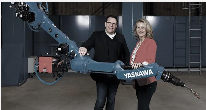
Robots bij Nooteboom in 2021

Het doel is een toekomstbestendige vestigingsplaats zijn voor Wijchense maakbedrijven, waar de bedrijven innoveren door elkaar te kennen, samen te werken en werken en leren te combineren. Bedrijven treden daarvoor naar buiten toe, zoeken elkaar op en nemen het voortouw bij samenwerkingsverbanden met onderwijsinstellingen, realiseren flexplekken voor innovatieve samenwerkingspartners en intensiveren het parkmanagement. Die beweging willen we stimuleren, versterken en uitdragen in de openbare ruimte (en in de regio).